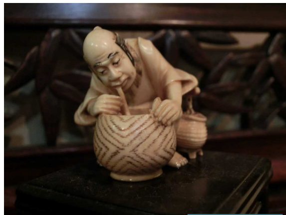
煙草に火鉢で火をつける男の根付