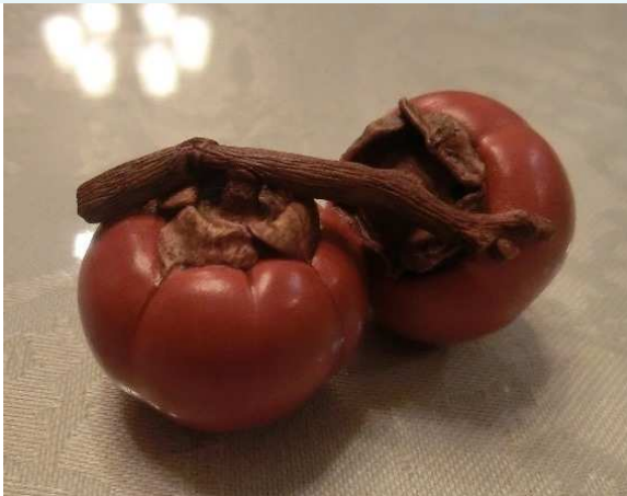
5 cm ほどの柿の根付 細かい細工が本物のよう